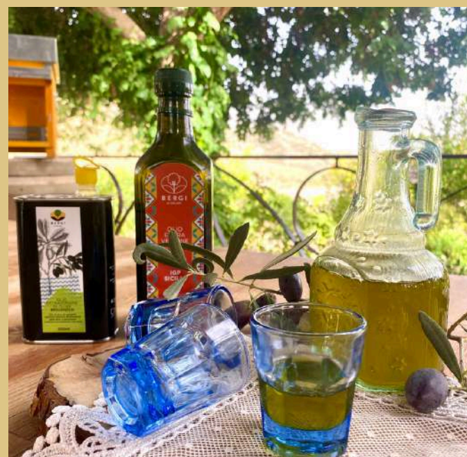
Liscio come l'olio Smoothly as oil