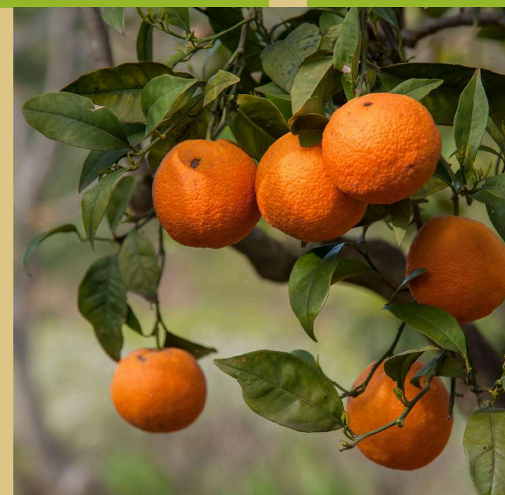
La via della Zagara Zagara route