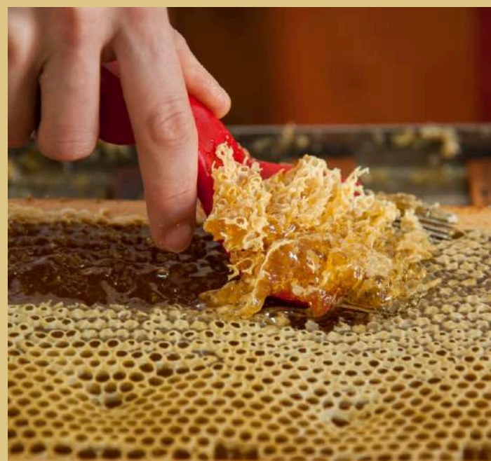
Dalle Api al Miele From Bee to Honey