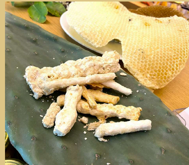
La Manna cade ancora dal Cielo The Sky is full of Manna!