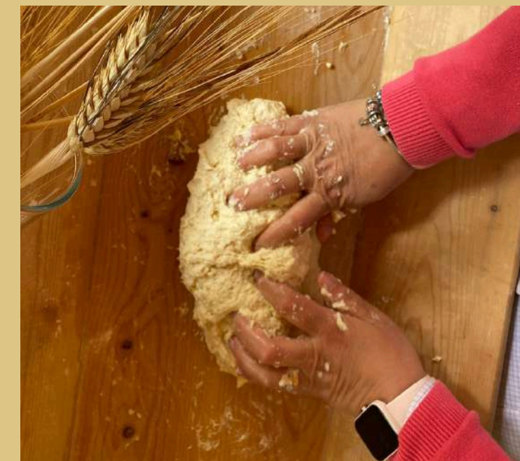
Con le mani in pasta Hands-on Sicily Edition